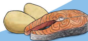
Salmão e batata